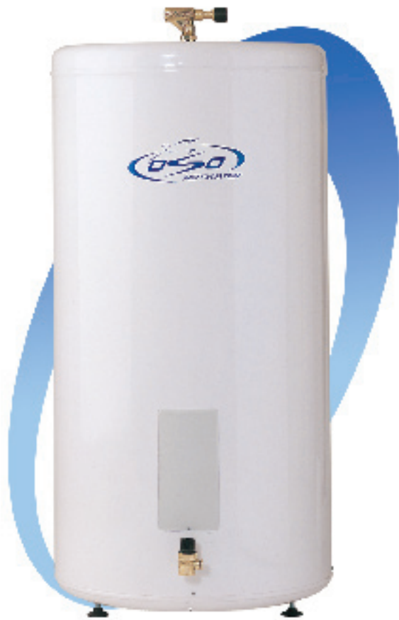
OSO RSS 200 - Skumisolert